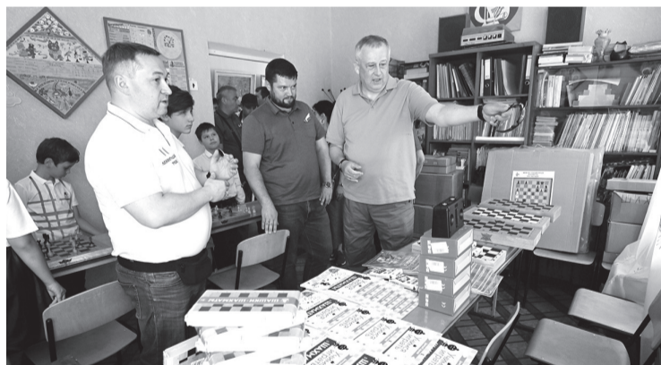
Ленинградская область обновляет книжный фонд в школах и библиотеках Енакиево

— Ленобласть действительно многое сделала на территории Енакиевской агломерации. В которую, помимо самого города Енакиево, входят ещё несколько населённых пунктов. К слову, эти поселения также в порядке шефства распределены за отдельными районами Ленобласти.