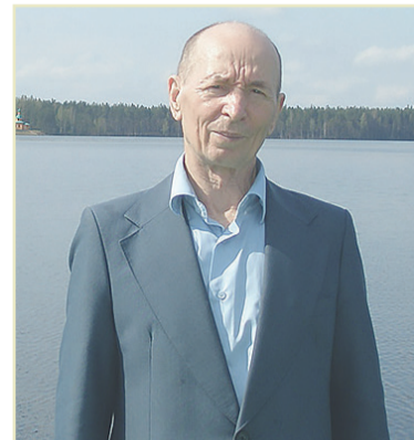
Автор: Виктор ТРИФОНОВ, вепсский поэт, уроженец Немжи (Винницкое сельское поселение Подпорожского района)