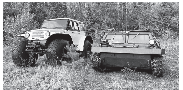
Современная техника позволила поднять самолёт в короткие сроки

При ударе о землю самолёт сильно пострадал. Бронелисты разорвало пополам, фюзеляж изкорёжило. Тем удивительнее, что тела членов экипажа практически не были повреждены. Сохранилось обмундирование, документы. В кармане лётчика