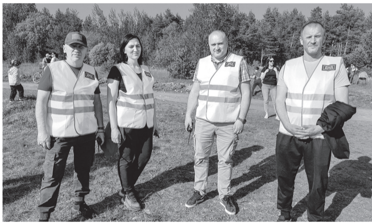
Дружинники из Приозерска помогают полиции на массовых мероприятиях

Благодаря главе администрации Приозерского района Александру Соклакову наши дружинники обеспечены удостоверениями установленного образца, форменной одеждой, помещениями, соответствующими санитарным нормам, средствами связи и оргтехникой. Совместно с муниципальными депутатами мы также прорабатываем вопрос об оказании комплексной помощи добровольным общественным организациям на будущее, включая меры финансовой поддержки.